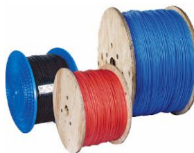
Bobine in Plastica e in Legno Plastic and Wood Reels