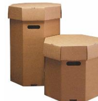
Fusti di Cartone Cardboard Boxes