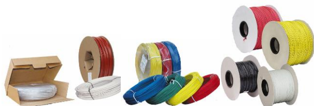
Matasse e Bobine di cartone Coils and Cardboards Reels